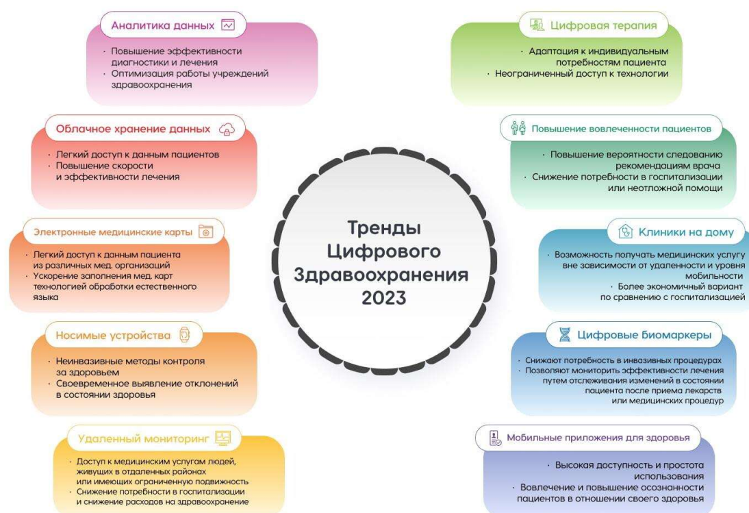
Рис. 6. Ключевые тренды развития цифровых медицинских технологий в мире.

Примером медицинских носимых устройств являются уже ставшие для многих людей обыденными смарт-часы и другие «умные» гаджеты. Они легко синхронизируются со смартфоном при замерах медицинских показателей и передают их в приложения, используемые поставщиками медицинских услуг.