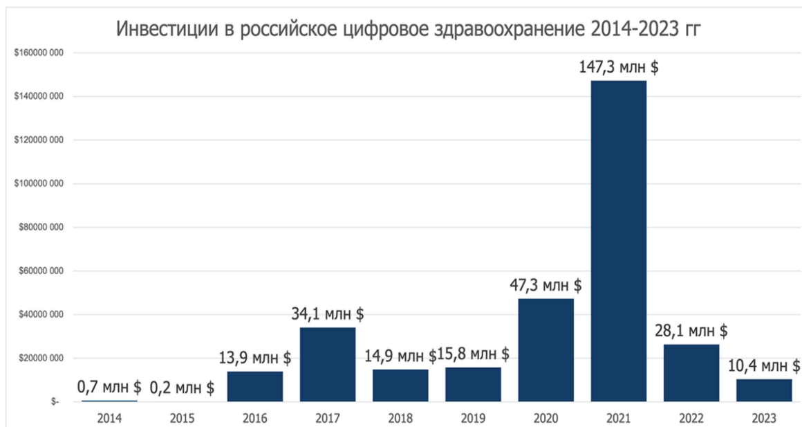
Рис. 4. Инвестиции в российское здравоохранение.

Развитие цифровых технологий становится ключевым драйвером развития фармацевтической отрасли российского здравоохранения. Главное достижение цифровизации – принципиальное упрощение, ускорение и снижение расходов на разработку и производство новых медицинских препаратов. Это обеспечивается за счет широкого внедрения цифровых платформ и технологий нового поколения, прежде всего, искусственного интеллекта и BigData.