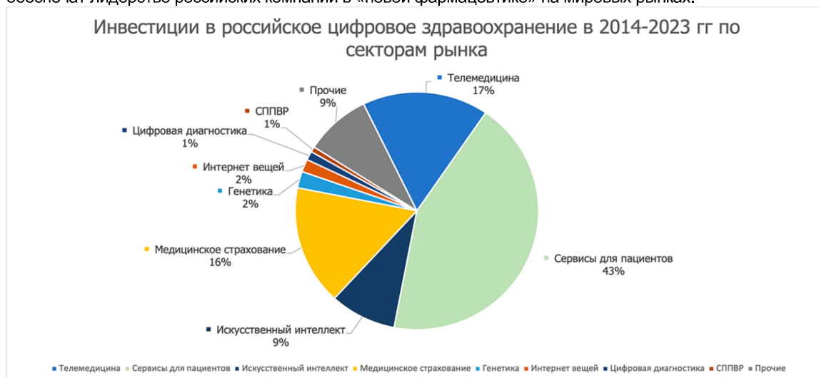
Рис. 5. Инвестиции в российское здравоохранение.

Для России новые перспективы, которые открывает на рынке фарминдустрии использование цифровых технологий, это возможность дать мощный импульс развитию малого бизнеса и решить целый комплекс социальных вопросов. Системным государственным подходом может стать разработка и реализация в России программы «Фармацевтика 3.0». Ее основной целью станет формирование и развитие критически важных для отрасли цифровых технологий лечения больных онкологией и другими заболеваниями. Эти технологии обеспечат лидерство российских компаний в «новой фармацевтике» на мировых рынках.