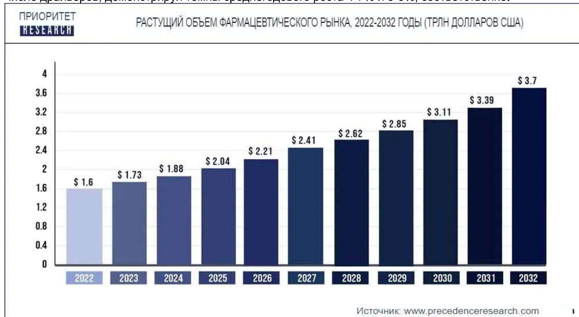
Рис.3. Объем фармацевтического рынка 2022–2032 в трлн. долл. США [2].

триллиона долларов США, и ожидается, что к 2032 году он превысит около 3,70 триллиона долларов США. При этом ожидаемый среднегодовой темп роста составит 8,80% с 2023 по 2032 год. В числе ключевых игроков мирового фармацевтического рынка будут выступать Индия, Китай, Южная Африка, Бразилия, Россия, Индонезия и Турция [2]. Фармацевтические рынки США и развивающихся стран также останутся в числе драйверов, демонстрируя темпы среднегодового роста 4-7% и 5-8%, соответственно.