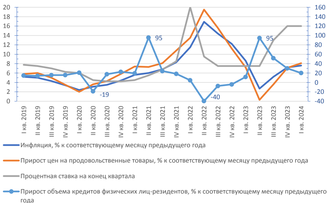
Рисунок 2. Зависимость инфляции от ключевой ставки Банка России и прироста объема кредитования физических лиц-резидентов

Ключевым фактором ужесточения денежно-кредитной политики (ДКП) Банка России является повышенный внутренний спрос, который превышает возможности рынка по расширению предложения [2]. С 2015 г. целью регулятора стало снижение годовой инфляции до 4%, что соответствует медианному уровню среди стран с развивающимися рынками (СФР), и, хотя это значение выше, чем в развитых странах (1-3%), оно учитывает специфику ценообразования и структуру российской экономики, а также мировой опыт таргетирования инфляции (рисунок 2).