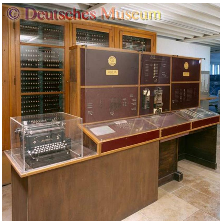
Рисунок 1. Цифровая вычислительная машина Z4 Германа Цузе

Это определение в России принято считать официальным. Оно точно акцентирует внимание на информации (данных) в цифровом формате и, по крайней мере, не мешает правильному пониманию сути дела. Кроме того, это определение, используемое в официальных документах, в целом не противоречит образу, созданному в сознании специалистов благодаря книге Тапскотта и другим публикациям, развивающим те же идеи. Наконец, хочется напомнить, что определения не очень нужны, если мы имеем дело с реальностью, а не с логическими конструкциями или математическими моделями. Если вы хотите объяснить ребенку, что такое тигр, отведите его в зоопарк и покажите тигра. Если у вас в городе нет зоопарка, то можно сказать ребенку, что тигр – очень, очень большая кошка. Это будет определение. Но хоть сколько-нибудь понятным оно будет, если ребенок видел кошку.