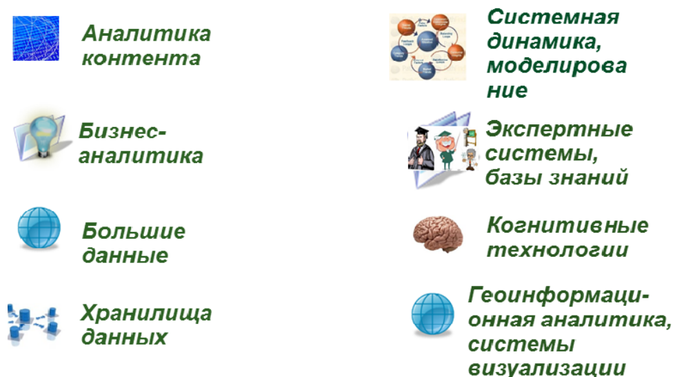
Рис.4. Аналитические и когнитивные технологии «цифрового предприятия».

На рис.4 представлены наиболее распространенные аналитические и когнитивные технологии «цифрового предприятия».