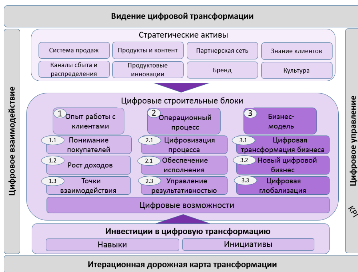
Рис. 1. Концептуальная рамка цифровой трансформации

Авторами [1] была разработана концептуальная рамка (framework) цифровой трансформации, представленная на рис.1.